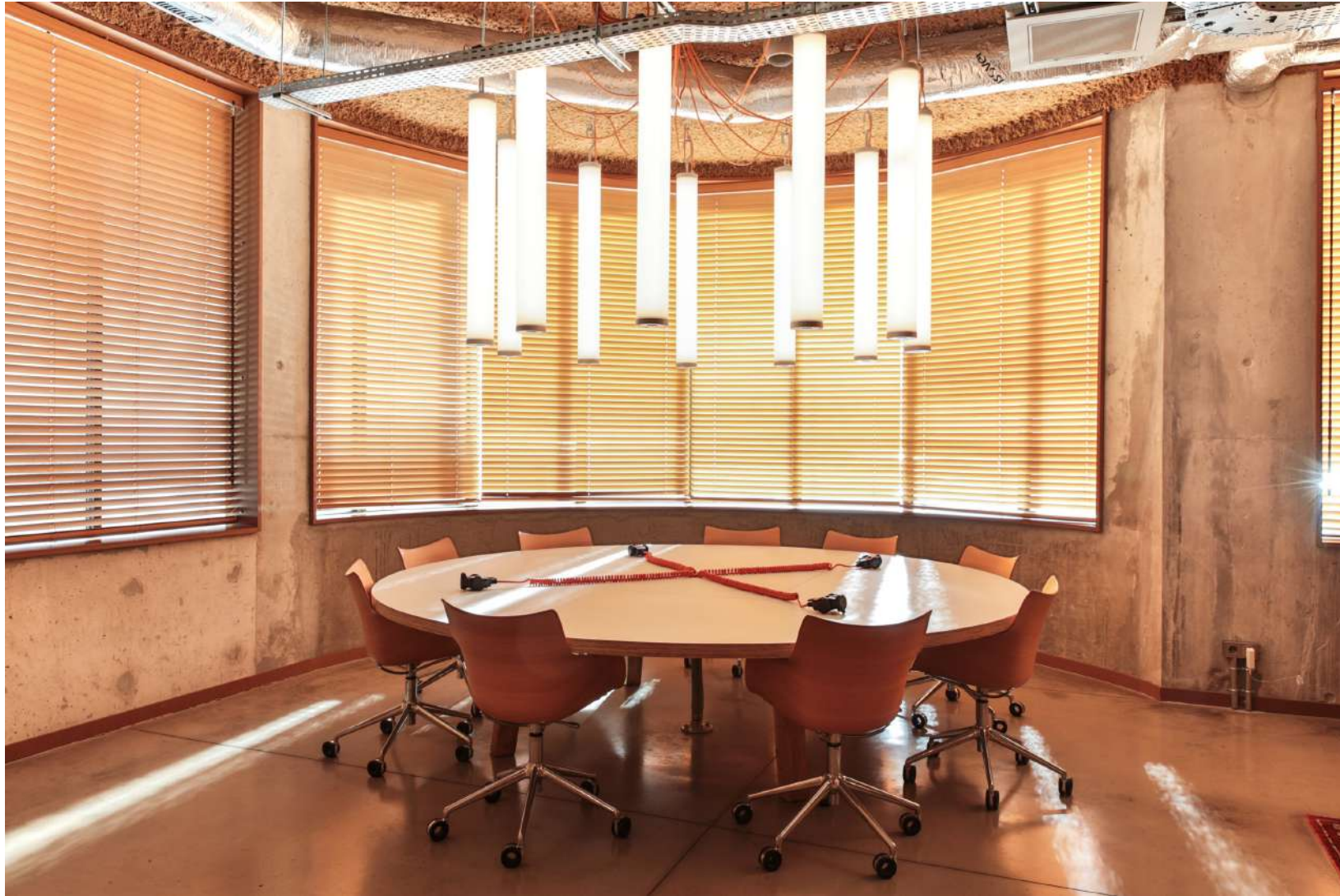
Table des conspirateurs